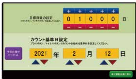
マウス操作で基準日設定